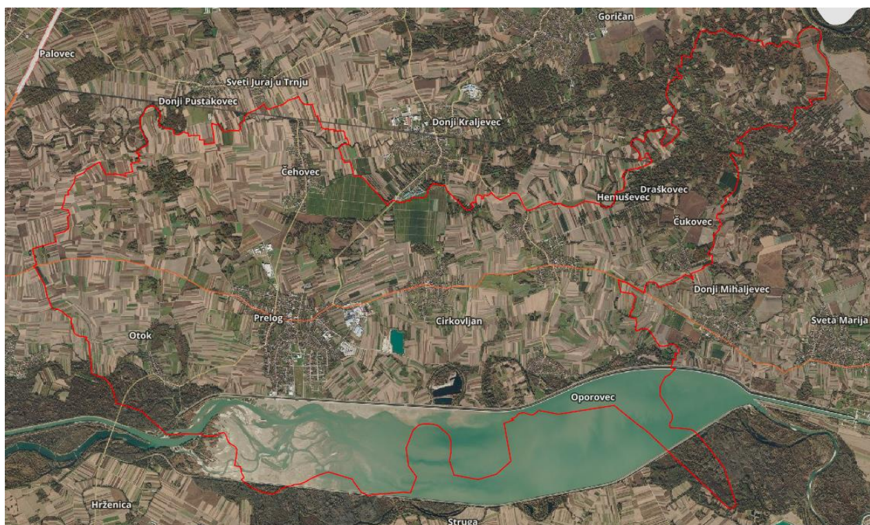
Slika 1. Površinski obuhvat Grada Preloga

Grad Prelog po veličini je druga jedinica lokalne samouprave u Međimurskoj županiji, koja graniči sa Varaždinskom županijom, a u okvirima Međimurske županije graniči sa slijedećim općinama: Sveta Marija, Goričan, Kotoriba, Donji Kraljevec, Mala Subotica i Orehovica.