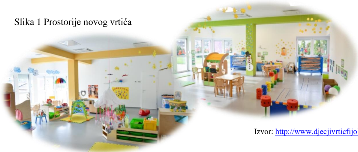
Slika 1 Prostorije novog vrtića