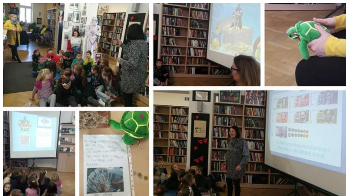
Slika 6 Suradnja sa Knjižnicom i čitaonicom Grada Preloga