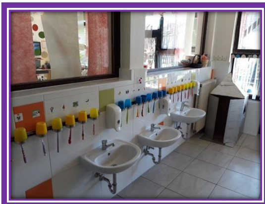
Slika 4 Uređenje PO Cirkovlajn

U područnom objektu u Cirkovljanu, tijekom ljetnih mjeseci, adaptirao se sanitarni prostor (novi odvodi, novi sanitarni čvor, pločice – podne i zidne). Ukupni iznos radova bio je cca 35.000,00 kn i osnivač, grad Prelog, je u cijelosti podmirio troškove.