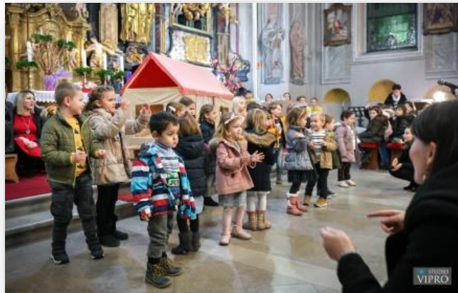
Slika 2 Nastup vjerske skupine "Vrapčići" iz Cirkovljana