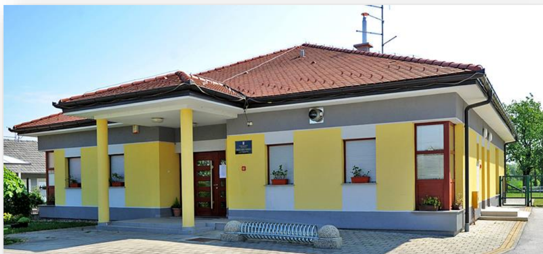
Slika 5 Područni objekt u Draškovcu