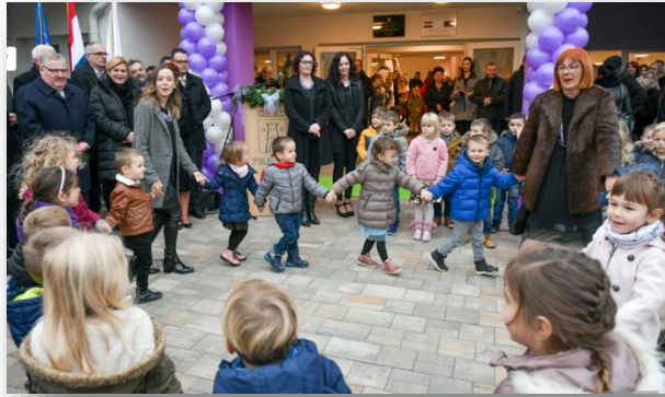
Slika 3 Otvorenje vrtića 04.12.2019.