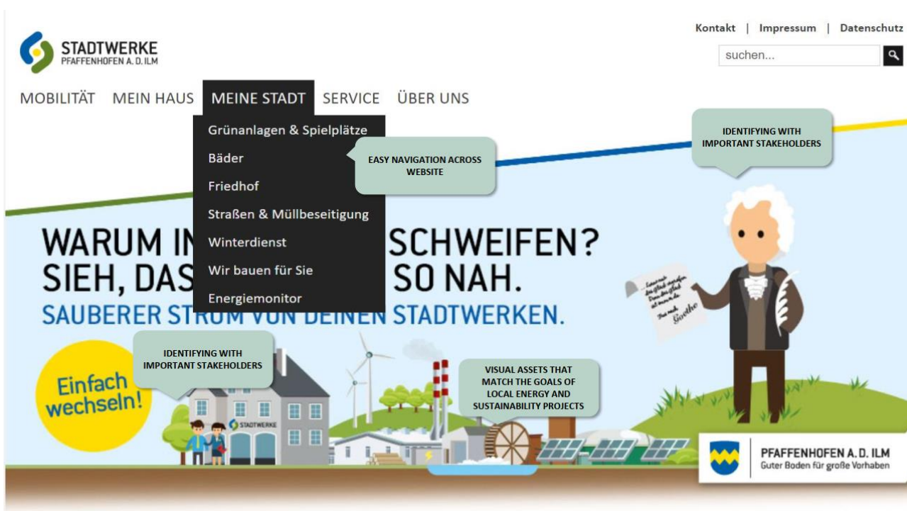
Alat 3 primjer: Primjer dobre prakse u komunikaciji

U sljedećem izdanju biltena predstaviti ćemo vam još jedan vrlo zanimljivi alat: Smjernice za procjenu investicija u građanske energetske projekte - tehnički, ekonomski i pravni aspekti (Alat 2).