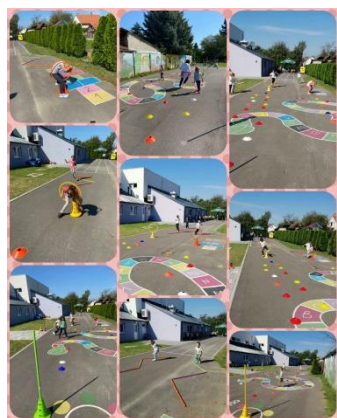
Slika 4 Kreativnosti kroz godinu

Temeljna zadaća odgojno-obrazovnog rada djece rane i predškolske dobi je poticanje razvoja kompetencija djece stvaranjem stimulativnog socijalnog i prostorno-materijalnog okruženja te pružanja izravne i neizravne podrške cjelovitom razvoju djece: tjelesnom, jezičnom, spoznajnom, socijalnom i emocionalnom.