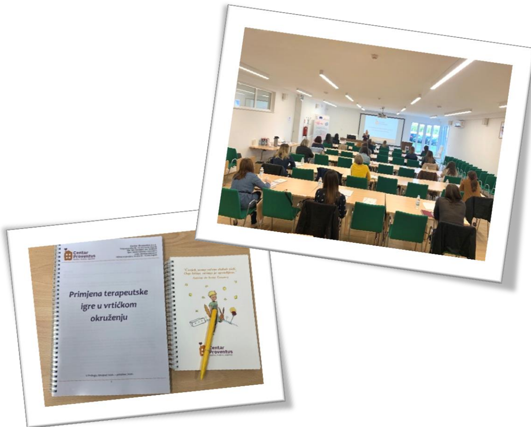
Slika 3 Edukacija za odgojiteljice