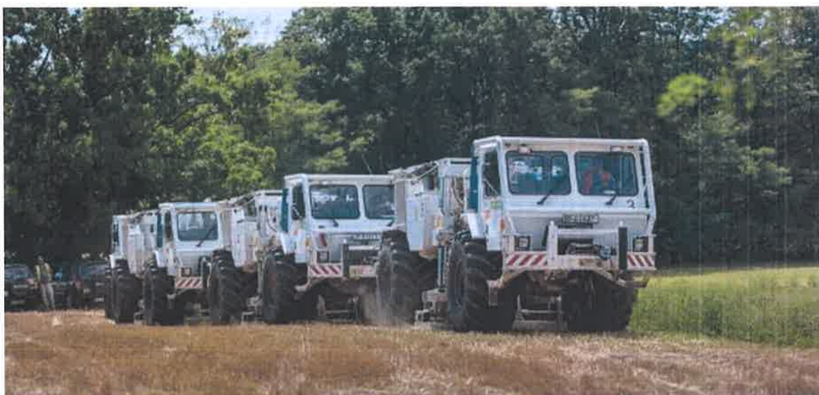
Slika 2.1 Vibratorska flota (3 vibratora na točki izvora)

Na cijelom projektu kao izvor energije koristit će se vibratori, radna vozila težine oko 20 tona, dimenzija 8x3 m kojima se generira akustični val koji se širi u podzemlje i reflektira od slojeva u podzemlju, nakon čega se vraća na površinu i registrira geofonima. Vibratori će se kretati uz trase linija izvora koje će međusobno biti razmaknute 240 – 300 m te vibrirati na točkama izvora svakih 30 - 40 m. U dvije flote koje će se kretati po terenu biti će uvijek 2 ili 3 vibratora u figuri, u liniji - jedan iza drugoga, Slika 2.1.