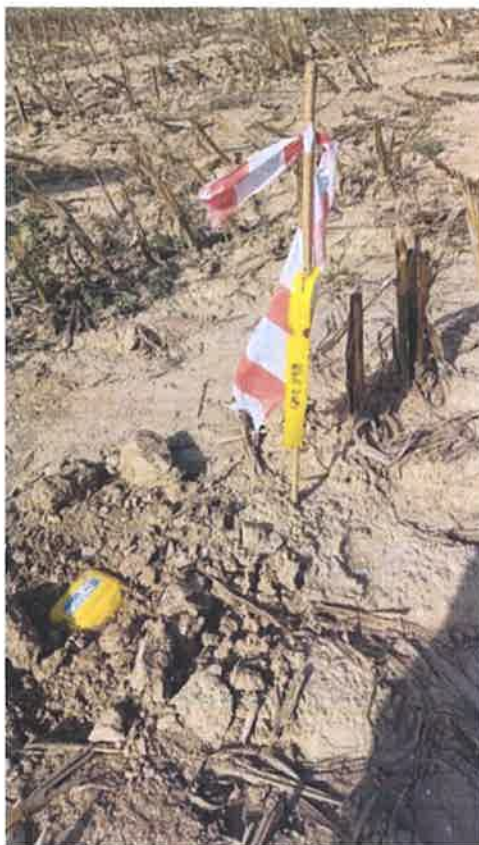
Slika 2.2 Bežični geofon (prijamnik) i njegova pozicija na terenu (označena geofonska točka)